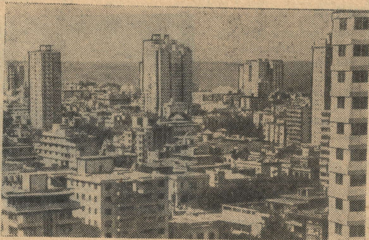
На снимке: столица Республики Кубы — Гавана.