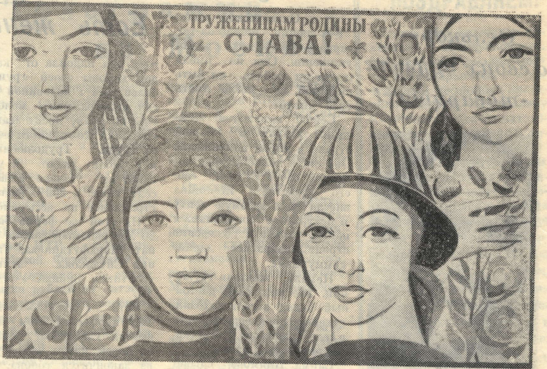
Плакат художника Э. Арцруняна (издательство «Изобразительное искусство»).