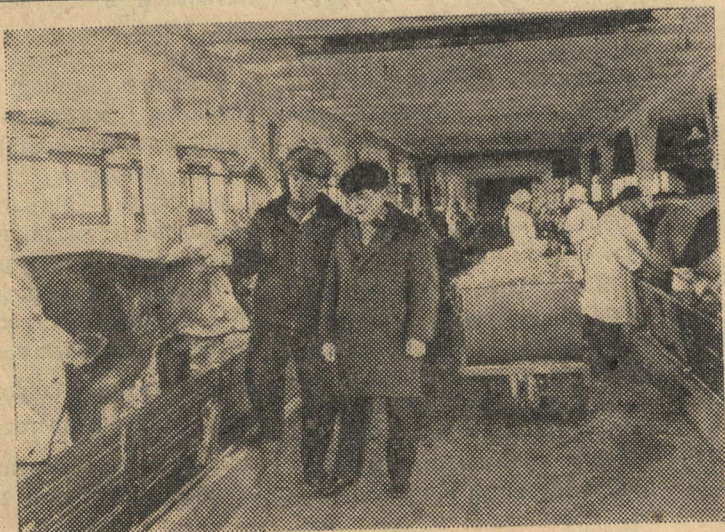
5 ноября—50 лет со дня подписания соглашения об установлении дружественных отношений между РСФСР и Монголией

—Сельские труженики! Боритесь за успешное выполнение решений XXIV съезда КПСС по дальнейшему развитию сельского хозяйства! Повышайте урожайность всех культур и продуктивность животноводства, увеличивайте производство продукции! Улучшайте использование техники, трудовых и материальных ресурсов!