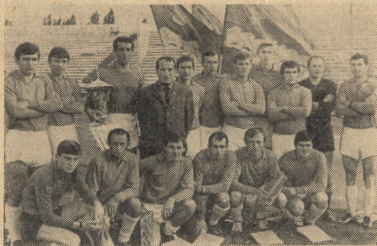
КРАСНОДАР. В третий раз подряд завоевали кубок «Золотой колос» футболисты Бучачского совхоза «Дружба» Украинской ССР. В популярных соревнованиях участвовали лучшие сельские футбольные коллективы страны. На снимке: команда совхоза «Дружба».