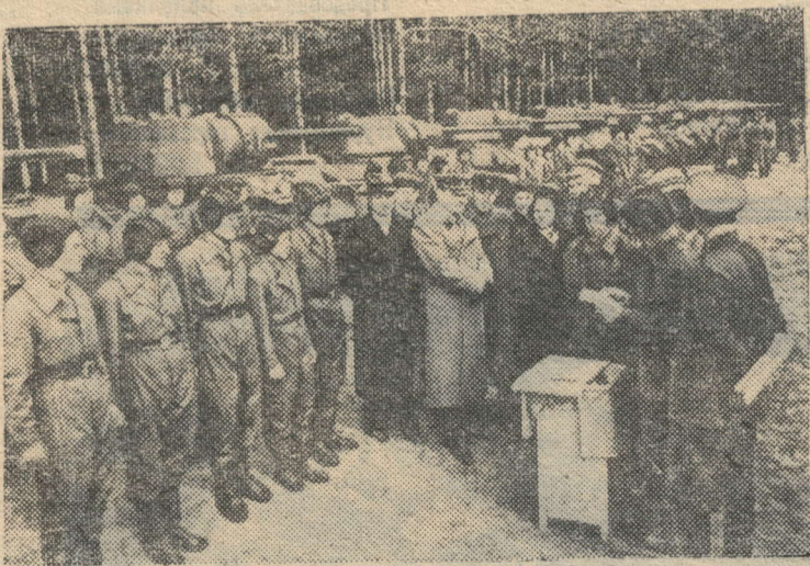
Представитель танковой части Красной Армии зачитывает акт о передаче танков. Действующая армия, 1942 год.