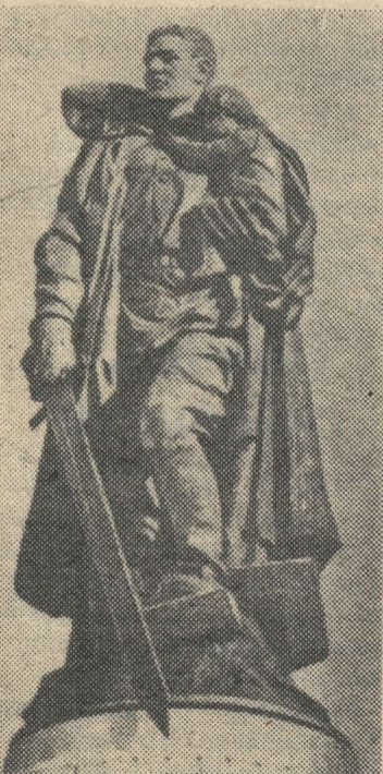
ГДР. БЕРЛИН. Памятник советским воинам в Трептов-парке.