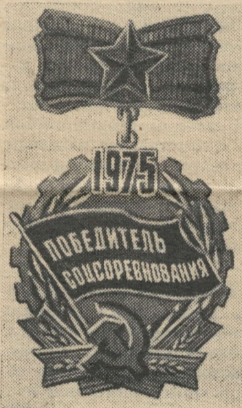
Единый Общесоюзный знак «Победитель социалистического соревнования 1975 года».

Недавно на общем собрании коммунистов колхоза «Дружба» обсуждался вопрос «Задачи партийной организации колхоза «Дружба» в свете Постановления ЦК КПСС «О состоянии критики и самокритики в Тамбовской областной партийной организации».