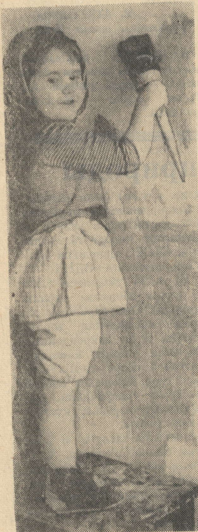
Вот обрадуется мама!