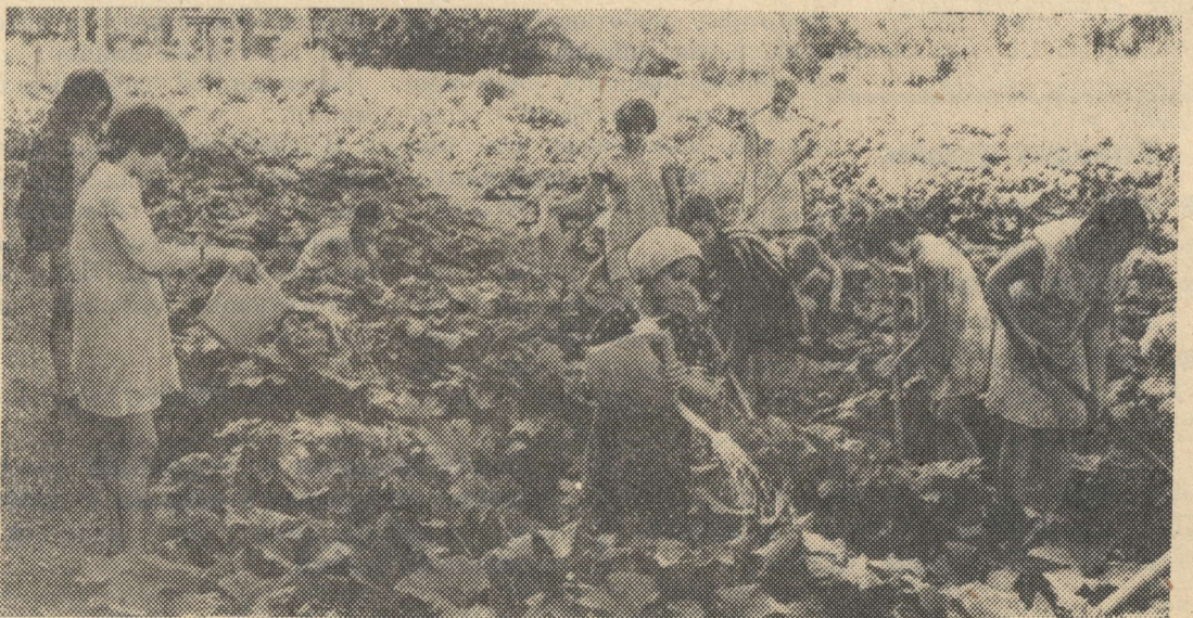
На опытном участке школы № 3.