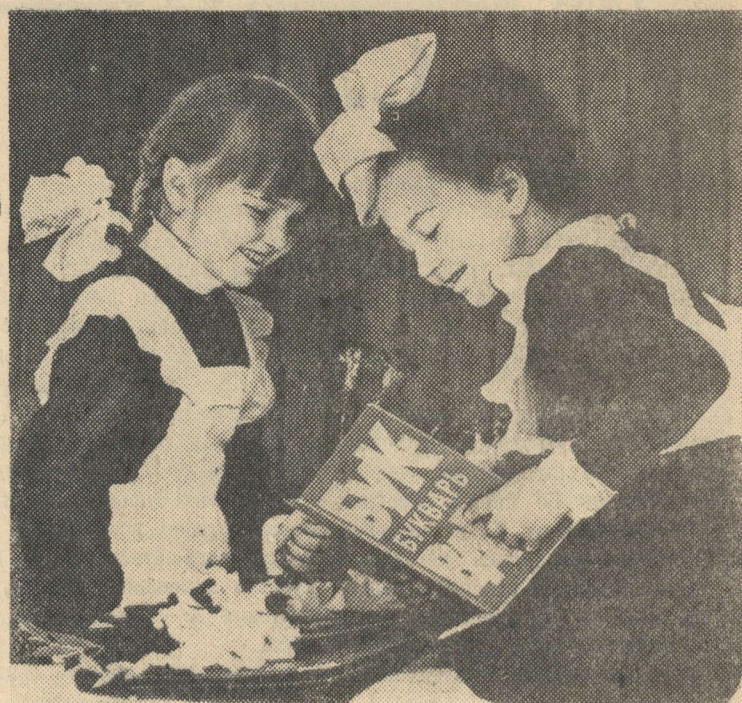
В Советском Союзе — первый класс... Воспитанницы фрунзенского детского общего образования — 1 сентября каждый третий гражданин начинает новый учебный год.

Животноводство у нас по праву называют передним краем. Потому усилия всех тружеников села сегодня должны быть направлены на то, чтобы обеспечить надлежащую подготовку к зимовке общественного скота.