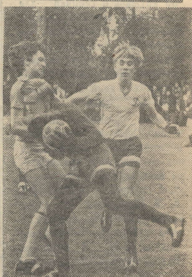
На снимках: на тренировке; на матче.