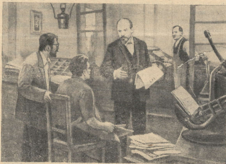
«Искра». Картина художника Д. Налбандяна.