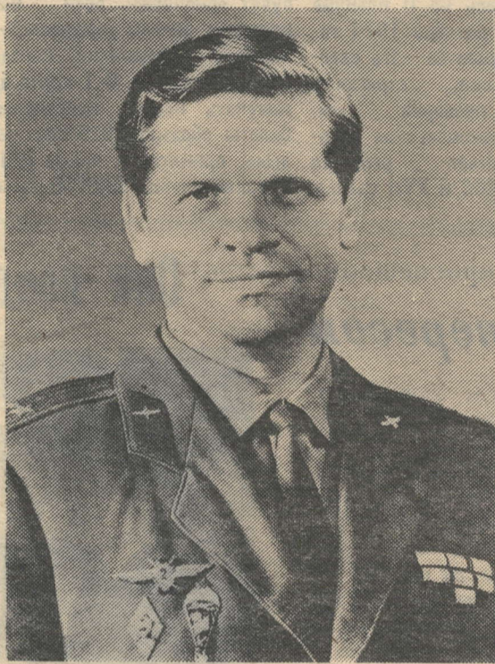
Командир экипажа космического корабля «Союз-17» Алексей Александрович Губарев.