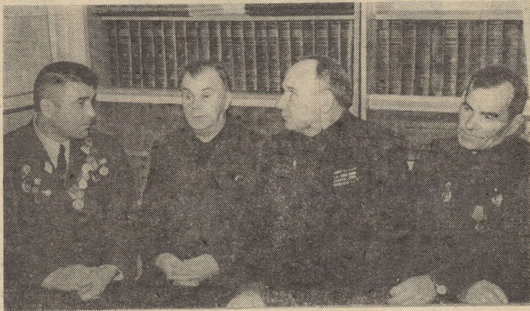
во время встречи местных журналистов с группой участников Великой Отечественной войны в Пресс-клубе редакции.

От души поздравляем этих товарищей и в лице их всех фронтовиков со светлой датой в жизни Вооруженных Сил.