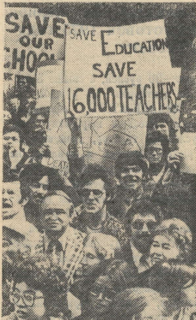
США. Американские учителя ведут упорную борьбу за удовлетворение своих требований.

На снимке: «Спасите наши школы», — требуют участники массовой демонстрации в Нью-Йорке против сокращений ассигнований на нужды образования.