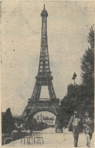
ПАРИЖ. Одна из достопримечательностей Парижа — Эйфелева башня (на снимке) была построена французским инженером А. Г. Эйфелем для всемирной выставки в 1889 году.

Башня сделалась неотъемлемой частью столицы. Раз в семь лет Эйфелева башня обновляет «свои туалеты», требуя для этого 35 тонн краски.