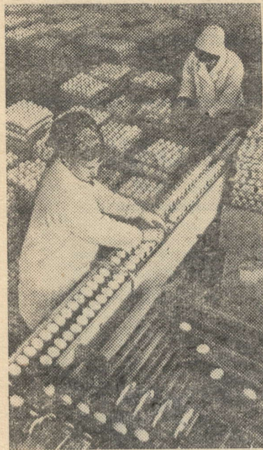
ЧЕЛЯБИНСКАЯ ОБЛАСТЬ. В магазины Челябинска и других промышленных центров области регулярно поступает продукция новой птицефабрики.

С полным завершением строительства в цехах предприятия годовая производительность достигнет 300 миллионов яиц и 2,5 тысячи тонн мяса.