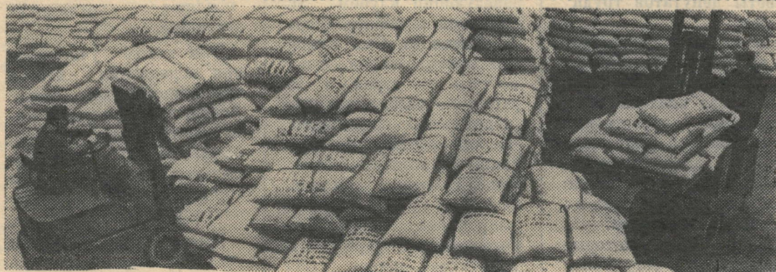
ТОЛЬЯТТИ (Нуйбышевская область). Тысячи тонн различных удобрений сверх задания изготовил с начала года коллектив Нуйбышевского азотного завода имени 50-летия СССР.