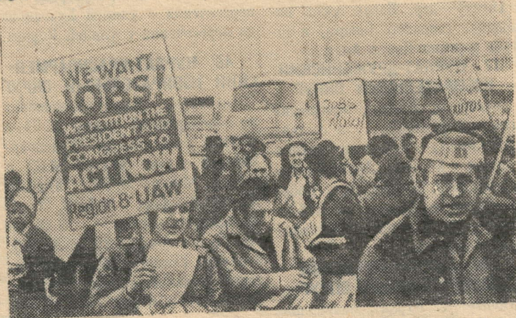
США. Массовая манифестация рабочих, уволенных с автомобильных заводов, состоялась в Вашингтоне. Последствия инфля-

суровые меры в отношении всех лиц, которые будут препятствовать претворению в жизнь этой реформы и добровольно не передадут государству свои поместья и фермы.