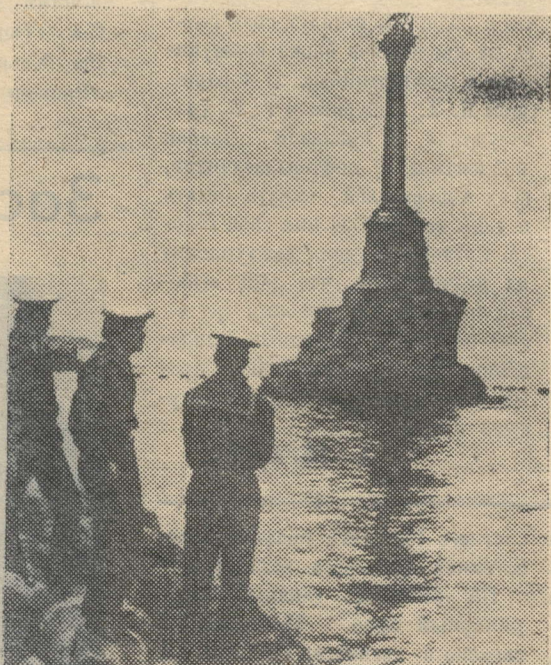
Памятник затонувшим кораблям в городе-герое Севастополе.