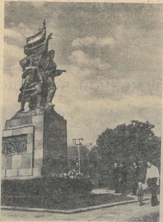
НОВОРОССИЙСК. Памятник воинам-защитникам Новоросийска на площади Свободы.

Всего за время войны на советско-германском фронте было разгромлено 607 дивизий противника.