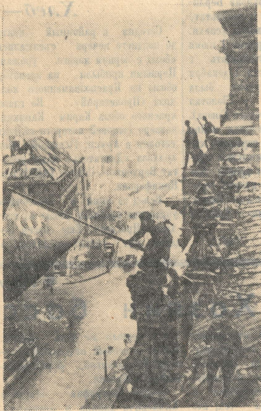
Момент водружения Знамени над рейхстагом в Берлине в 1945 г.