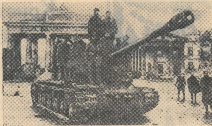
Советские танки у Бранденбургских ворот. Берлин. 4 мая 1945 года.