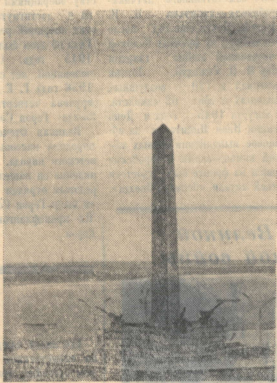
Памятник воинам отдельной Приморской армии и морякам Азовской военной флотилии на горе Митридат в городе-герое Керчи.