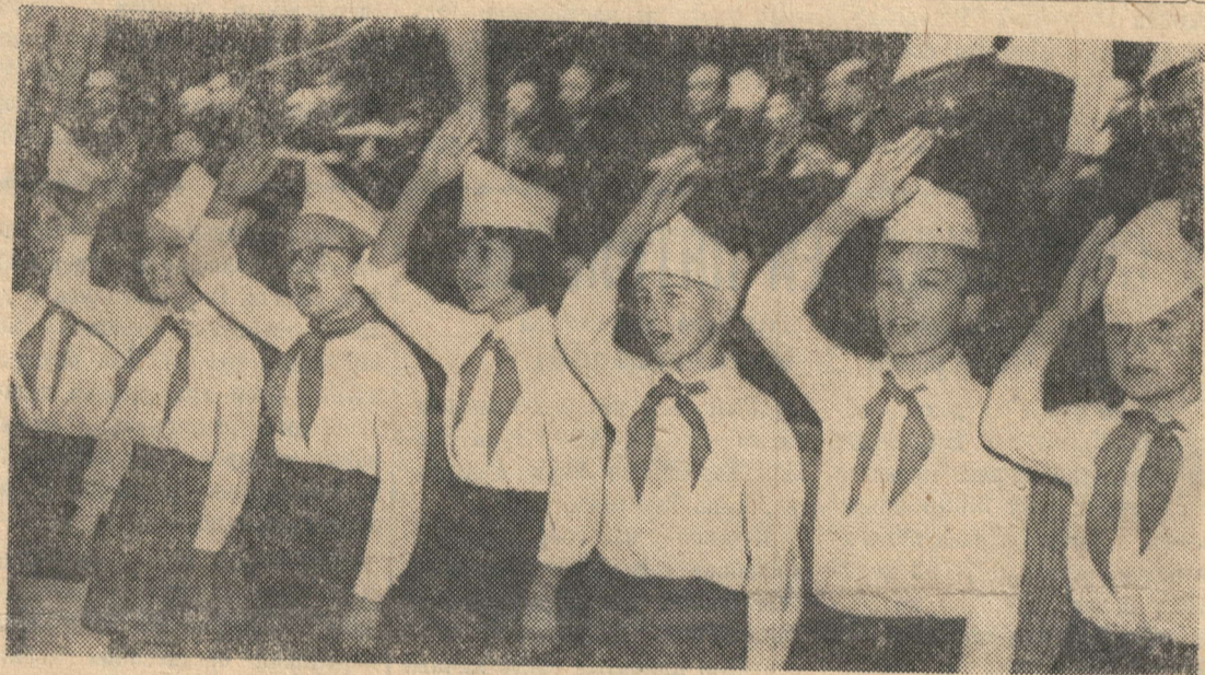
ЮНЫЕ ПИОНЕРЫ ГОРОДА НУРЛАТ ПРИВЕТСТВУЮТ ДЕЛЕГАТОВ РАЙПАРТКОНФЕРЕНЦИИ.

Надежная основа была заложена и под урожай будущего года. Мы произвели подкормку пастбищ и полив—800 кубических метров воды на гектар, предприняли ряд мер по обеспечению сохранности оборудования. Можно с уверенностью сказать, что задание будущего года будет выполнено.