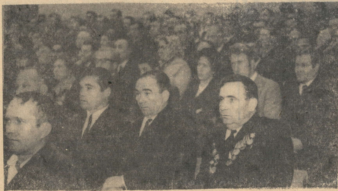
В ЗАЛЕ ПАРТИЙНОЙ КОНФЕРЕНЦИИ.

(Из постановления ЦК КПСС «О социалистическом соревновании за достойную встречу XXV съезда КПСС».)