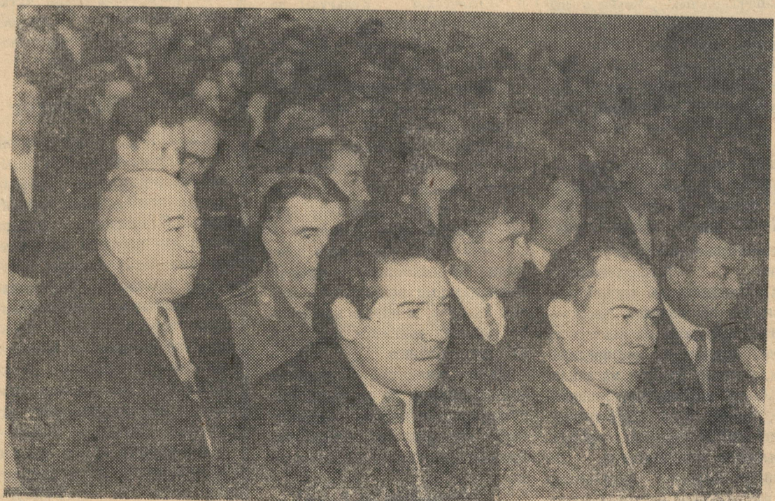
В ЗАЛЕ ПАРТИЙНОЙ КОНФЕРЕНЦИИ.