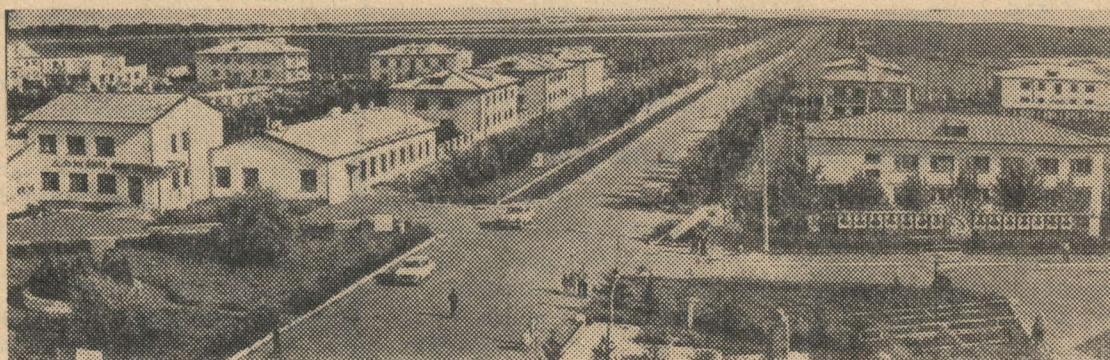
СССР и ВЦСПС, (а по итогам граждан переходящим Красным Знаменем ЦК КПСС, Совета Министров СССР, ВЦСПС и ЦК ВЛКСМ. На снимке: центральная усадьба совхоза «Лискинский».

Материалы специального выпуска «От съезда—к съезду» подготовлены нашим штатным корреспондентом И. Зариповым.