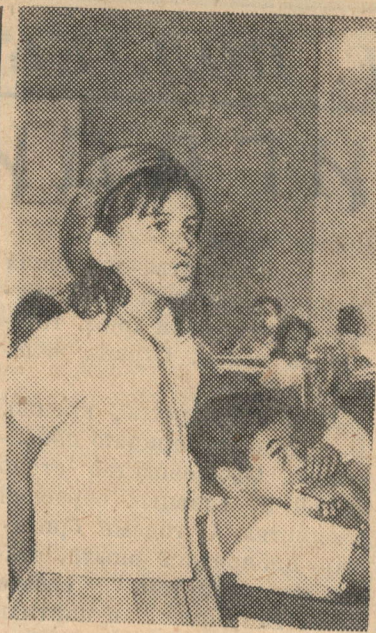
Школьный городок имени 26 июля в Сантьяго-де-Куба — первое крупное учебное заведение на Кубе, созданное революционным правительством.