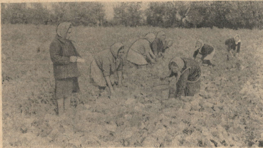
НА СНИМКЕ: бригада за работой.