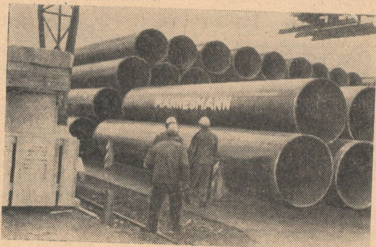
ФРГ. «Вятка» дала, прощальный гудок и отошла от причала Бременского порта. Теплоход взял курс на Ленинград. На его борту находилось 2.500 тонн труб большого диаметра. Заводы концерна «Маннесманверкерс АГ» отправили советскому заказчику очередную партию своей продукции. На снимке: штабеля готовых к отправке труб.