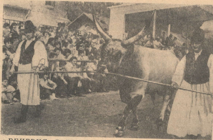
ВЕНГРИЯ. В Будапеште проходит традиционная Всевенгерская выставка сельского хозяйства и пищевой промышленности, демонстрирующая достижения страны в этих отраслях за 30 лет народной власти. На снимке: парад рекордсменов.