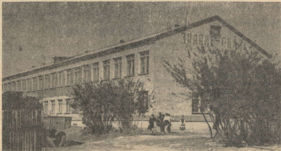
Так выглядит здание Ново-Альметьевской средней школы.