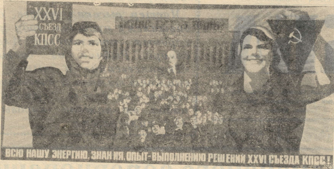
Плакат художника В. Кононова. Издательство «Плакат».