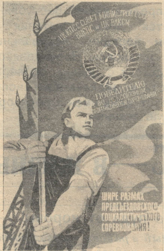
Плакат художника В. Ковалова. Издательство «Плакаты».