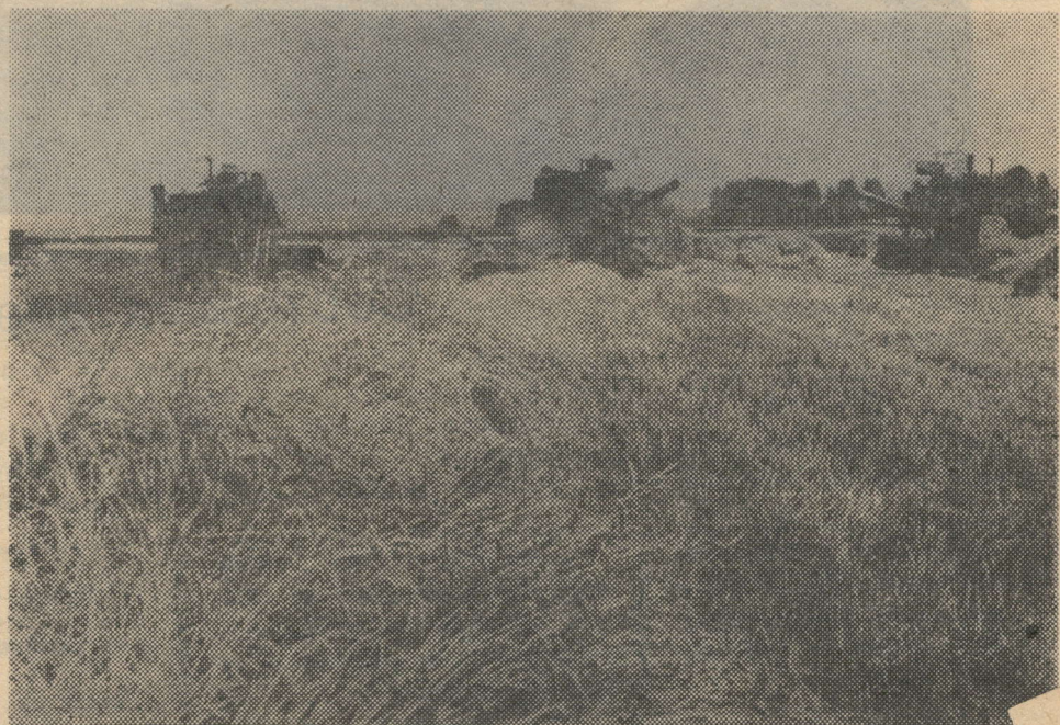
На последних гектарах.

...И вот мы снова едем по дорогам, бегущим по полям и лугам. Мысленно разделяем заботы и радости сельских тружеников, желаем им удач во всех делах. САМАТ ШАКИР.