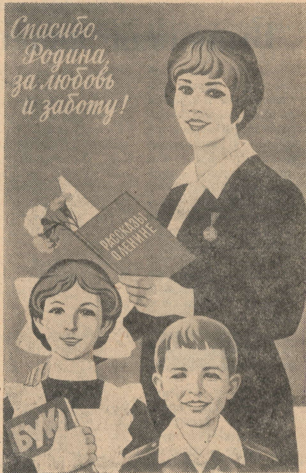
Плакат художника В. Конюхова