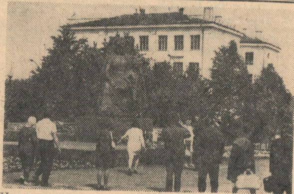
На снимке: Ульяновск. Памятник матери В. И. Ленина — Марии Александровне Ульяновой.