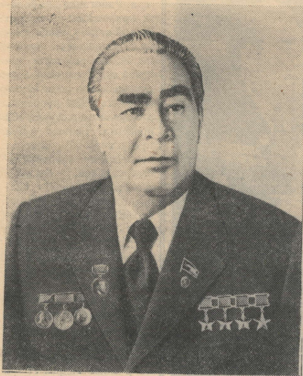
Генеральный секретарь ЦК КПСС, Председатель Президиума Верховного Совета СССР Леонид Ильич Брежнев.