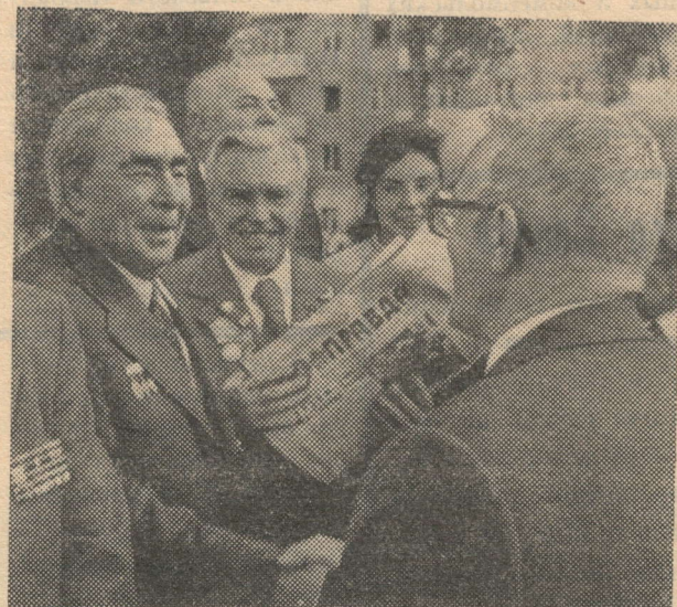
Л. И. Брежнев во время встречи с земляками, ветеранами труда города