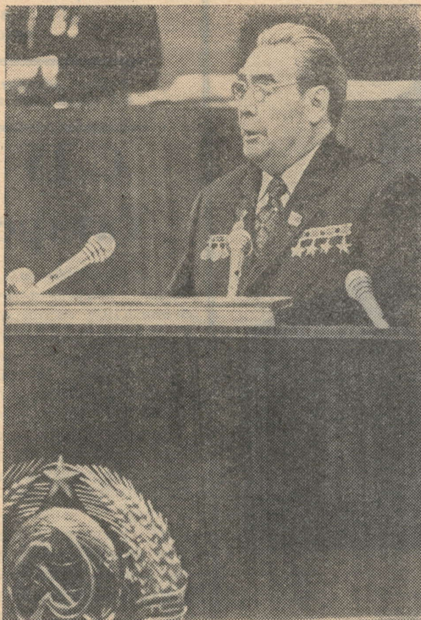
МОСКВА. XXVI съезд Коммунистической партии Советского Союза. На трибуне — Генеральный секретарь ЦК КПСС Л. И. Брежнев.

В настоящее время опубликована новая работа Л. И. Брежнева «Воспоминания». На снимке: произведения Л. И. Брежнева.