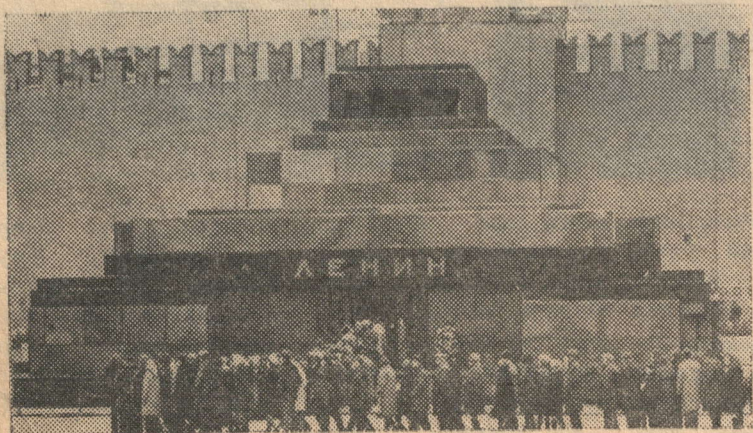
Москва. Красная площадь. У Мавзолея В. И. Ленина.

*** Когда мы в огнеметной лаве Решили все отдать борьбе— Мы мало думали о славе, О нашей собственной судьбе. По совести—другая думка У нас была светла, как мед: Чтоб пули были в наших сумках И чтоб работал пулемет! Мы горы выбрали подножьем И в сонме суши и морей Забыли все, что было можно Забыть. Забыли матерей. Дома, заречные долины, Полей зеленых горький клёк, Пески и розовую глину— Все то, что звало и влекло. Но мы и в буре наступлений, Железом землю замостив, Произносили имя Ленина, Как снова не произнести! Все было в нем: поля, и семьи, И наш исход из вечной тьмы,— Так дуб не держится за землю. Как за него держались мы!