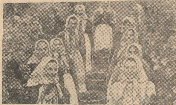
ва, на клубных сценах сельских Домов культуры, промышленных предприятий. На снимке: участники хора села Твардица.

«Дуслык» — орган Октябрьского РК КПСС и районного Совета народных депутатов Татарской АССР.