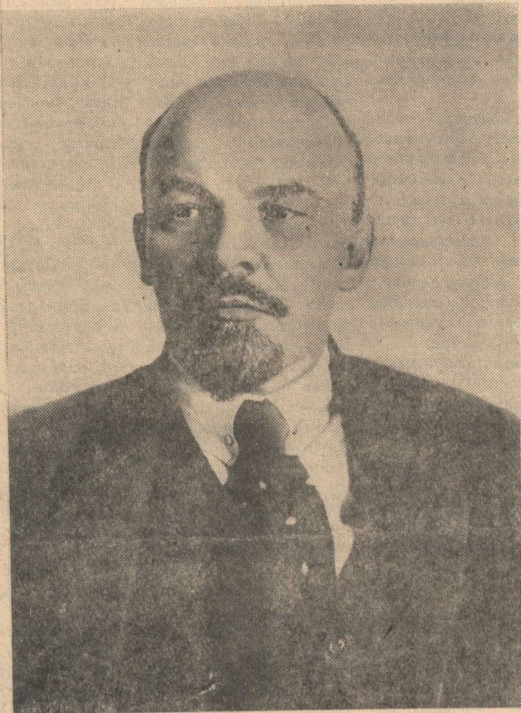
В. И. Ленин. Москва, октябрь 1918 года.