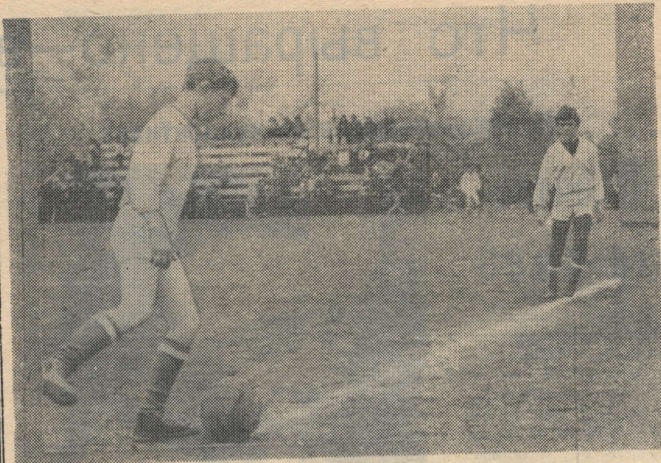
Лето — прекрасное время для укрепления здоровья, физического развития. Любителей спорта ждут футбольные поля, беговые дорожки, волейбольные площадки, баскетбольные площадки и водоемы. На снимке: очередная тренировка юных футболистов на центральном стадионе г. Нурлат.

— И часто виделись за эти пятнадцать лет? (Продолжение следует).