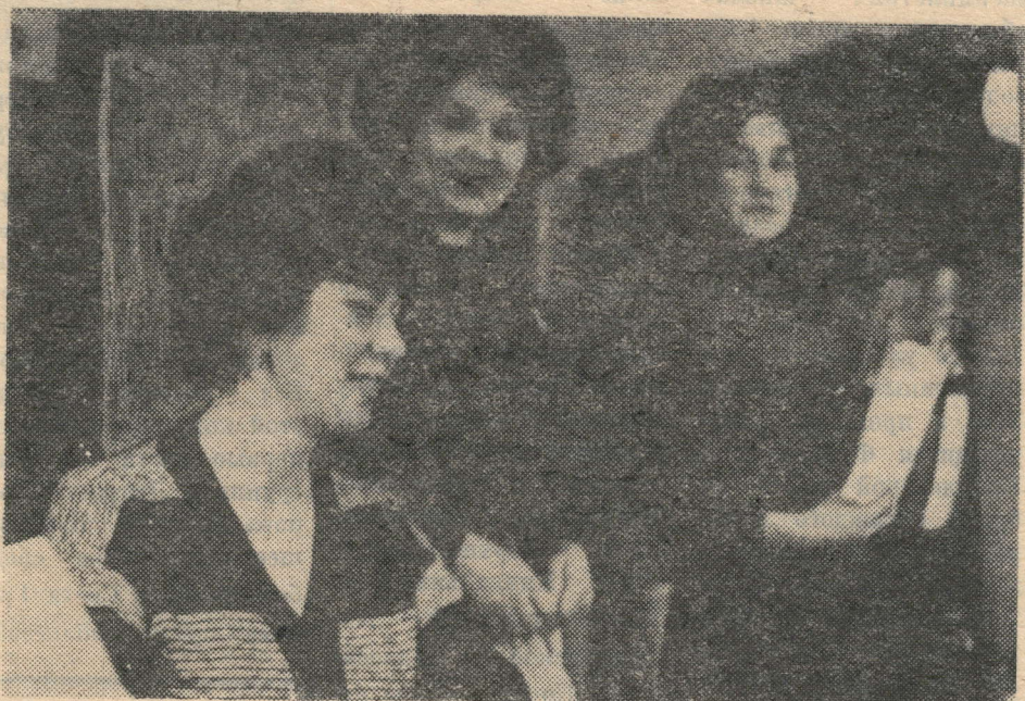
партии возможность систематически перевыполнять производственные задания.

В этом году нефтяники Татарии готовятся к знаменательному событию—добыче двухмиллиардной тонны нефти. Свой посильный вклад в это движение вносит контрольно-интерпретационная партия (КИП) Нурлатской геофизической конторы. Женский коллектив из 11-и человек несет нелегкую и ответственную службу: обрабатывает диаграммы, доставляемые сюда с пробуренных нефтеразведчиками скважин на предмет определения продуктивности нефтеносных пластов, дает ответ на вопрос—есть ли расчет осваивать их. Слаженность, обстановка взаимной помощи и требовательности дают