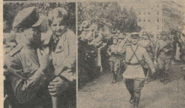
Разгромив вражеские полчища и полностью очистив от них Родину, Советская Армия начала освободительный поход по странам Европы, оказав их народам прямую помощь в борьбе с фашистской Германией.