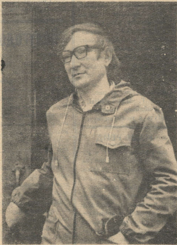
учится в Московском нефтехимическом институте.

В. Глухов показывает подчиненным пример неустанного поиска: он один из лучших рационализаторов НПК,