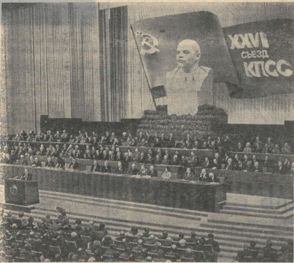
МОСКВА. Кремлевский Дворец съездов.

Вечером, 27 февраля, делегатов и гостей съезда приветствовали представители советской молодежи. Под звуки торжественного марша в зал Кремлевского Дворца съездов вошли колонны юношей и девушек, пионеры и октябрята. Бурными аплодисментами встретили делегаты победителей Всесоюзной эстафеты комсомольских дел «Десятой пятилетке ударный финиш! XXVI съезду КПСС — достойную встречу!». Юность страны рапортовала партийному съезду об участии в выполнении решений XXV съезда КПСС, успехах в труде и учебе. 28 февраля обсуждение доклада об основных направлениях развития страны было продолжено. Ораторы — представители партийных организаций республик, краев и областей выражали уверенность в том, что 11-я пятилетка ознаменуется новыми славными свершениями героического рабочего класса, колхозного крестьянства и народной интеллигенции, подчеркивали, что наши планы носят мирный, созидательный характер. О работе сельских школ — комплексом Белгород-