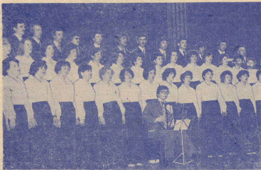
Выступает хоровой коллектив НУРБ.

«Дуслар» — орган Октябрьского РК КПСС и районного Совета народных депутатов Татарской АССР.