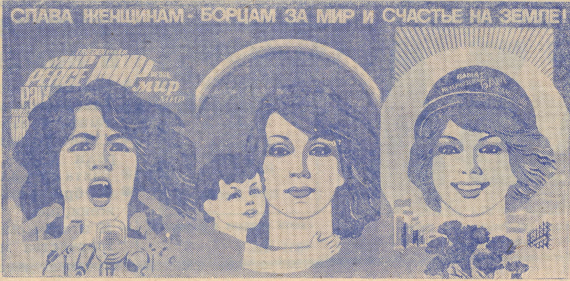
Плакат художников А. Бельского и В. Потапова. Издательство «Плакат».