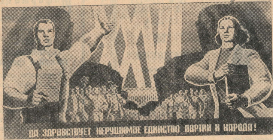
Плакат художника З. Смехова «Да здравствует нерушимое единство партии и народа!». Издательство «Плакат».

● В партийной организации колхоза им. Ульянова