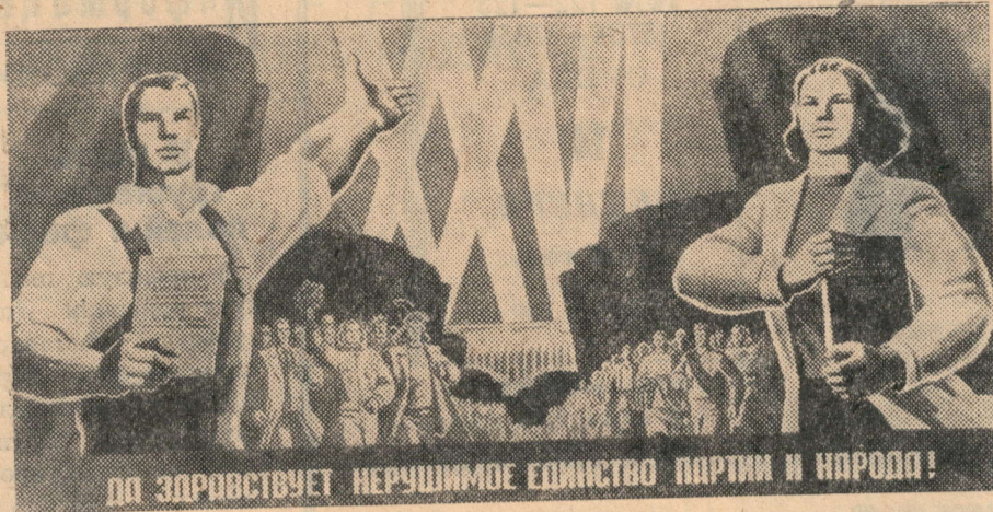
Плакат художника З. Смехова «Да здравствует нерушимое единство партии и народа!». Издательство «Плакат».