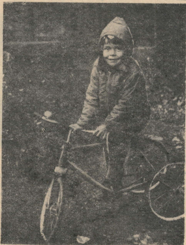
Оседлаю-ка я резвого коня... Фотоэтиюд.

В течение трех недель я находилась на лечении в железобетонном стационаре ленинградской больницы ст. Нурлат. Поступила сюда в крайне тяжелом состо-