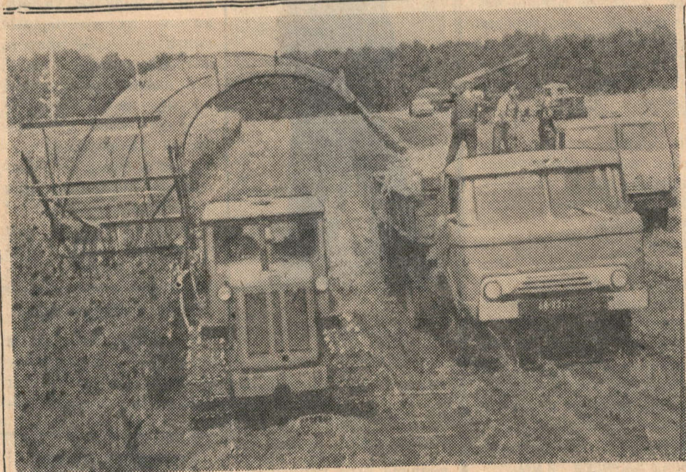
Своевременно завершили в этом году закладку раннего силоса колхозники колхоза «Россия». На снимке: идет уборка подсолнуха.