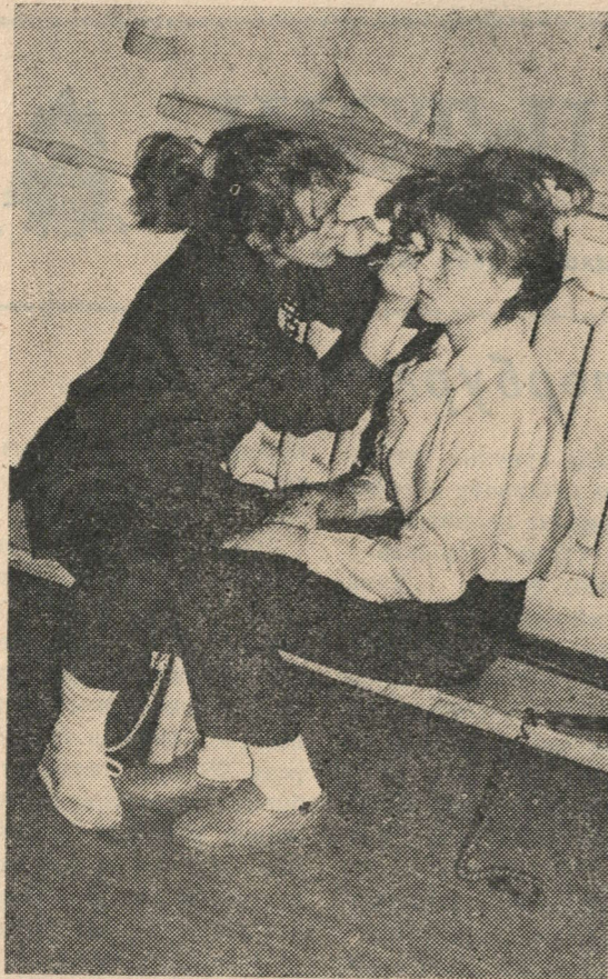
Яшь «артиет»лар сәхнәгә чыгарга әзерләнә. эмблемалар бирделәр.

ЭМБЛЕМА белән дә шундый ук хәл, пионерлар үз отрядларына эмблемаларны шөгылләренә хас итеп ясыялар. Мәсәлән, балалар берләшмәләре федерациясенә эмблемасы шыксыз үрдәк баласы. Әлбәттә киләчәктә ул гүзәл аккошка өйләнчәк дигән исәп тотыла. Ә Татарстан варис-пионерлары эмблеманы үзләре сайлый ала.