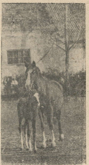
Менә күнме дистә еллардан бирле Тбилиси, Мәскәү, Ленинград, Ставрополь һәм Краснодар крайлары, чит илләр ил-подромнарында Кулар ат заводы атлары финишка беренчеләрдән булып киләләр.

Кулар ат заводы тарихы 1907 елда башлана. Аңа атаклы рус нефть промышленности Л. А. Манташев нигез сала. Завод болыннары һәм ат абзаллары Грузиянә күнчыгышындагы Храми түбәлекләренә жәелгән.