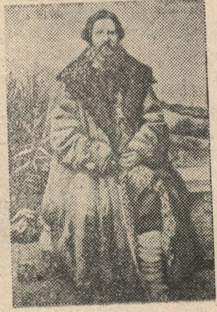
Күптән түгел Мәскәүдә «Идел—Россиянең қажыны» дип исемләнгән борыңгы откырытқалар күргәзмәсе булып үттә. Рәсемнәрдә: XIX гасыр башында Россиядә басылган откырытка үрнәкләре.