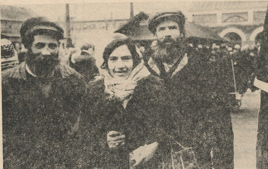
Якшәмбе көн базарда.

Май—40 сум (1 кг). Бал—40 сум (1 кг). Бәрәңге—1 сум 70 тиен. Тозлы кәбестә—3 сум 30 тиен (1 кг). Тозлы кыяр—8 сум (1 кг). Суган—5 сум (1 кг). Кишер—1 сум 80 тиен (1 кг). Торма—2 сум (1 кг). Сарымсак—30 сум (1 кг). Алма—11 сум (1 кг).