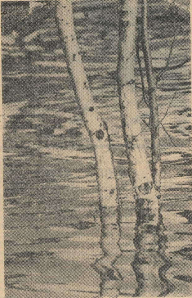
Кар сулары ага, Н. Туганов фотосы.

КАРТА. Яхшылап эшкәрткән картаны тозлы суда пешереп алалар да, салкын суда эйбәтләп югач, шакмаклап турыйлар. Аннары чуңга салып, вак кына тураган башлы суган, эре итеп туралган бөрәнге, кишер, ит шулласы өстәп, тоз сибеп, өстен нык итеп ябалар да мичтә яисә плитдә томалап пешерәләр. Пешкән картаны болгалалар һәм кайнар килеш тәлинкәләргә салып бирәләр. Каткыны аерым куялар.