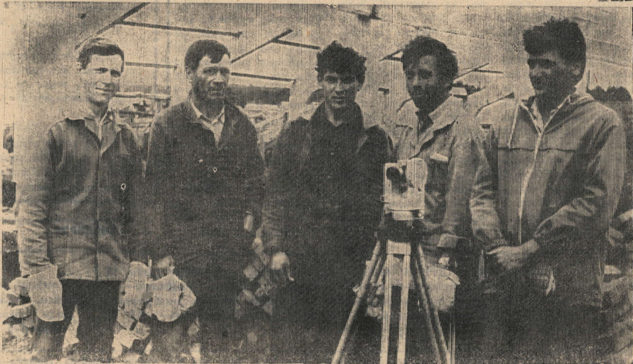
Рәсемдә: яшь төзүче