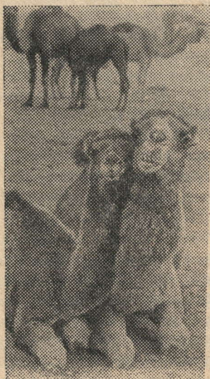
Рәсемдә: истәлек өчен гайлә белән рәсемгә төшкәннәр.