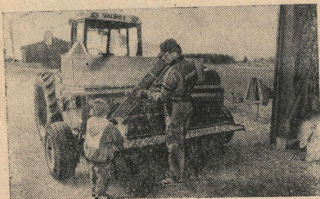
Финляндиядә жир эше яналклары буыннан-буынга күчерелә...