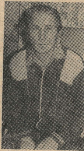
Жаваплы эшләр тора аның алдында.

Әйе, халык язмышы, аның киләчәген хәл итәсе