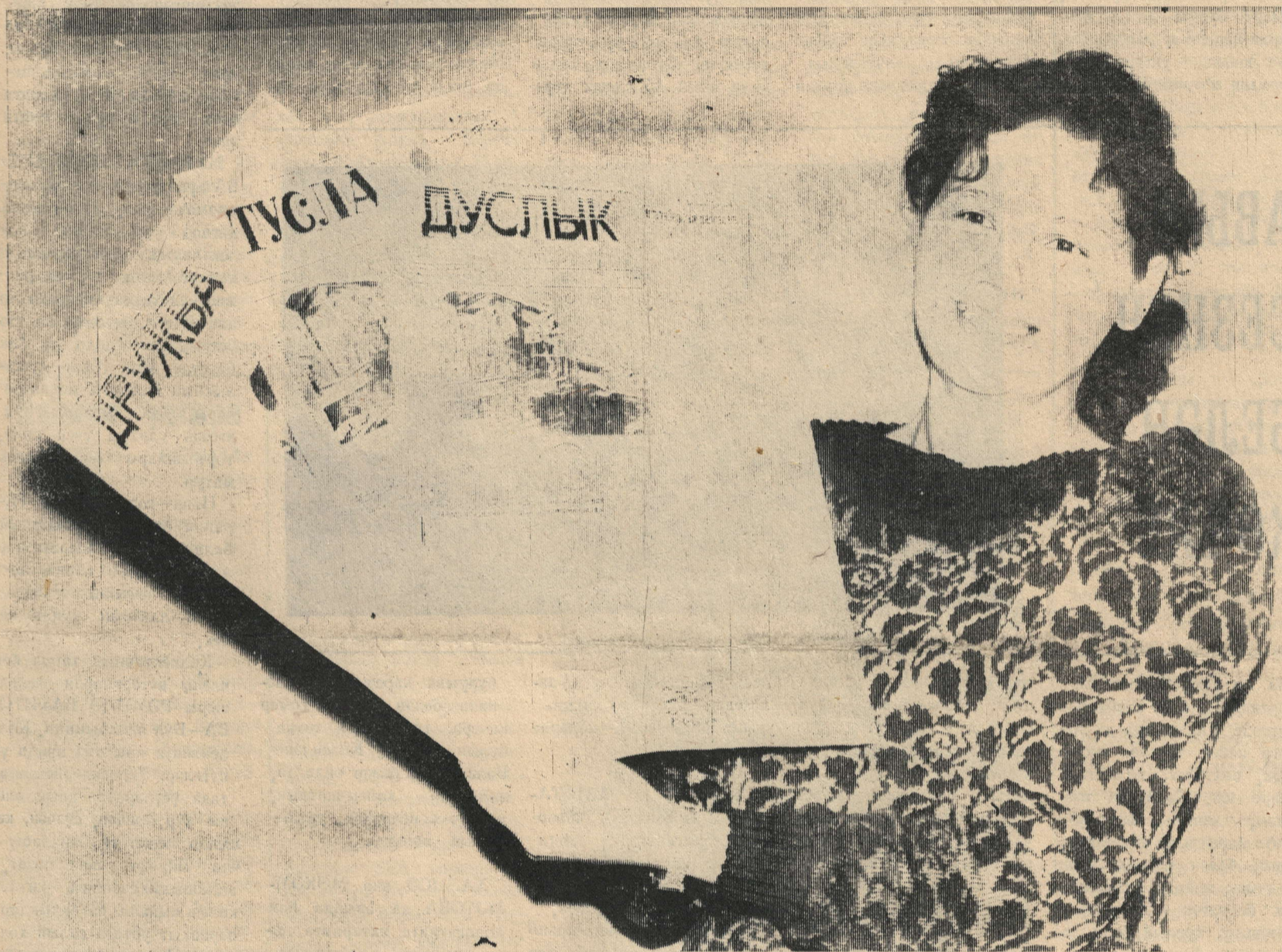
Исегезгә төшерәбез: газетаның еллык баясе— 6 сум 24 тиен, ярты елга —3 сум 12 тиен.

Хөрмәтле укучыбыз! Син безнең газетага язылдыңмы?