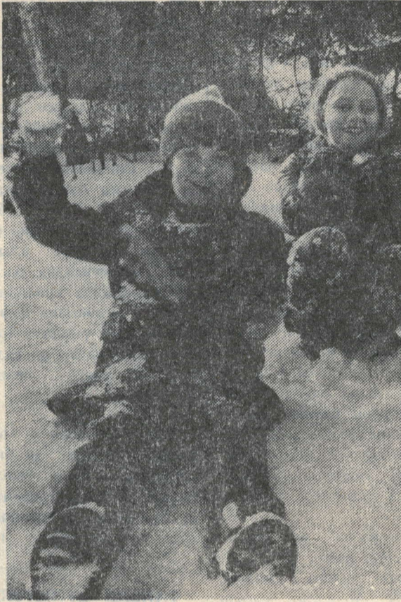
Әй, чабабыз чанада.