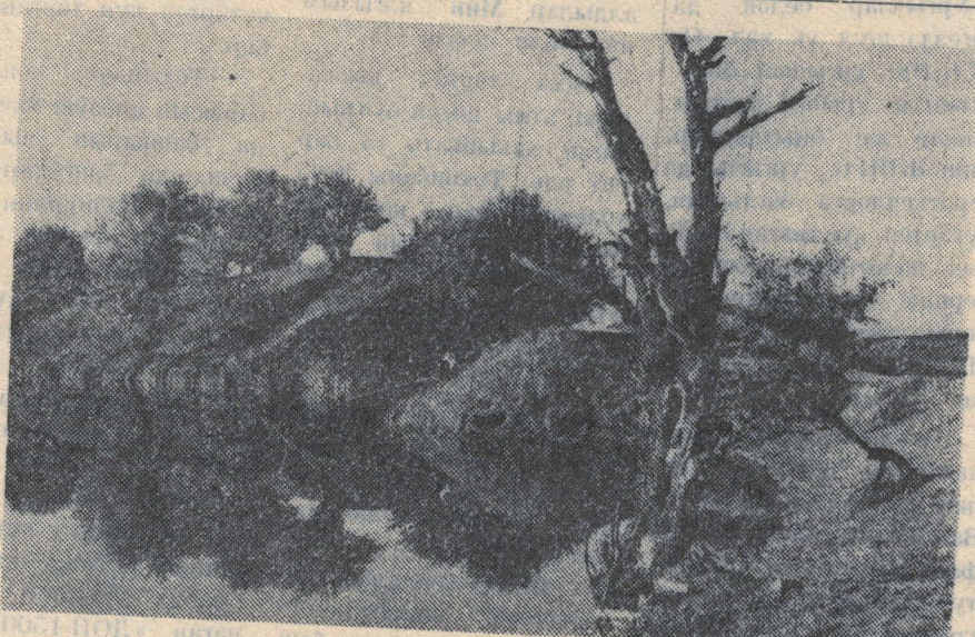
ГОМЕР КӨЗЕНДӘ.

31 октябрь көнне «Чулпан» кибетеннән 5 килограмм он алдым. Хезмәт вазифам буенча үлчәү белән эш итәргә эш туры килә миңа. Шуңа ахры, онны күтәрәп кайтып барганда күңелгә шик керде: нигә бу он жиндел рәк икән? Юлымда очраган күршемә шигемме әйттем һәм кайтып житүгә икәү бергә онны үлчөп карадык, он салынган пакетның авырлыгы төп-төгәл 4 килограмм иде. Өстемне дә салып тормастан он пакетын алдым да кызуланып кире кибеткә киттем. Кибетче (Л. Казакова) миңа дөшми-тынмыйгына, онны алып эчке бүлмәгә юнәлде. Әмма мин онны бу яктагы үлчәүдә үлчәвен таләп иттем. Ул үлчәргә маңбур булды. Онның кирәгеннән нәкъ 1 кило