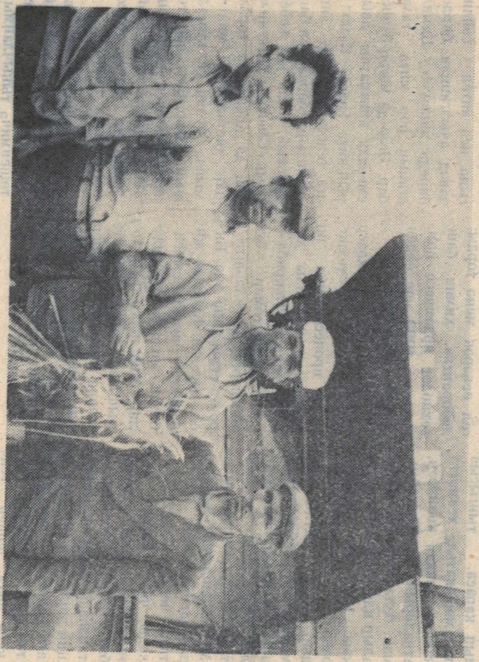
Районда хосусыйлаштыру чеклары тарату бара

Мәргүлум булганча 2 ноябрьдан республикада, шул ук вакытта безнен районда да Россия хосусыйлаштыру чеклары тарату башланды. Бу эш белән 31 пункт шәһәрләндә, аның 4 се — шәһәрләндә, калганнары авыл жи-рендә ашлы. Әлгә, мәргүмаглардан күрәнгәнчә, район халкына 6 меңнән артык чек таратылган һәм бу ашнә бермә-бер тизләтәсә бар. Ни өенемә? Бердән, Россия чеклары бәзнен республикада 1993 елның 1 январьнан гына таратылган, Россия на гәмәлгә керәләр, Россия территориясендә ул денәкәрдән үк үз көчәнә керә. Шунлай булган, аны иртәрәк алып өлгергән кеше Россия территория-сендә үз чельн иңдә фай-далы итәп ашкә. Да жи-тә-