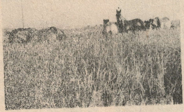
ЖӘЙГЕ СӨХРӨ

Учредительлар: редакциянөң йөзмөт коллективий һөй халык дө-путитларының Октябрь район Сө-бөты.